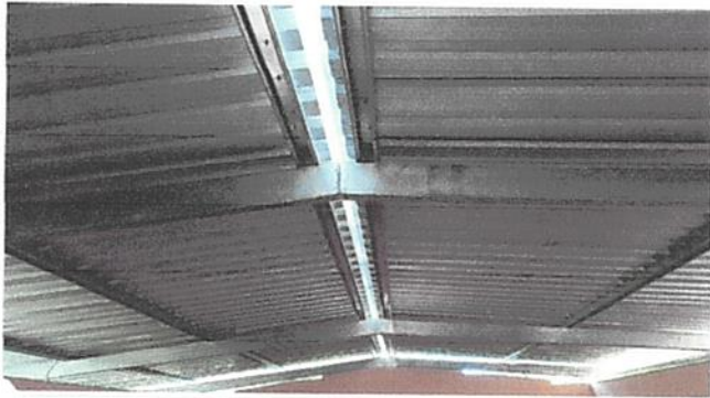
Substitución de lamina normal por lamina troquelada alusin calibre # 26.