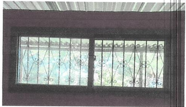
Suministro e instalacion de ventana.