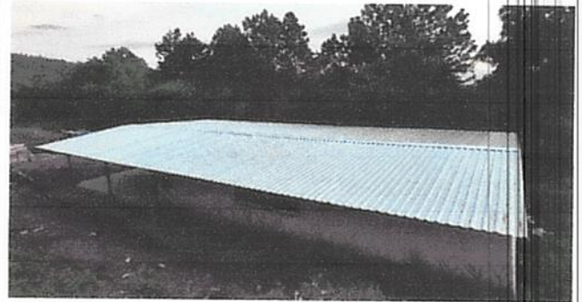
Desmontaje de lamina y estructura.